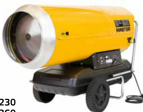
B 230 B 360