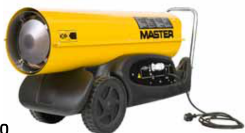
B 130 B 180